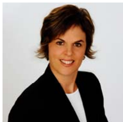
Par Hélène Sabourin, Directrice générale/Executive Director Fondation des infirmières et infirmiers du Canada Canadian Nurses Foundation